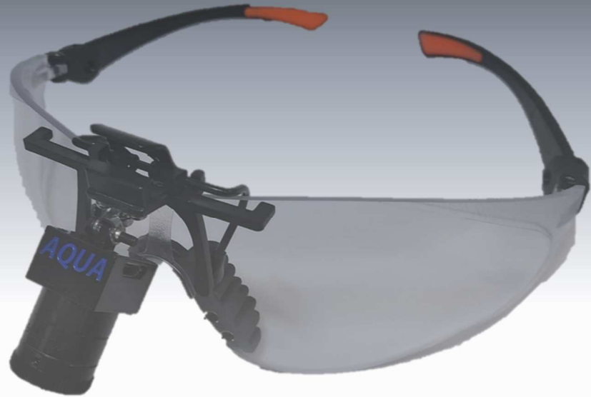
AQUA M Clip メガネ型手術用カメラタイプ