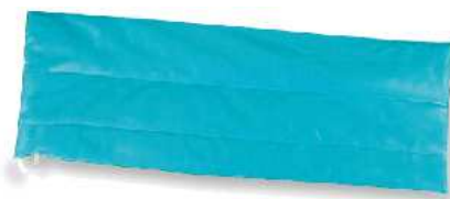
E Type 165 (L) x 72 (W)