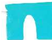
C Type 30 (L) x 40 (W)