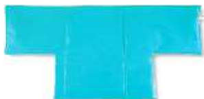
B Type 72 (L) x 88 (W) B-1 Type 118 (L) x 88 (W)