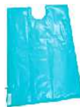
A-1-2 Type 73(L) x 100(W)