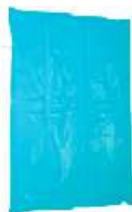
A-1 Type 73(L) x 100(W)