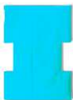
A Type 73(L) x 100(W)

側臥位、特殊な体位形成に（腎臓手術、脳性麻痺の患者や、整形、胸部外科等の体位形成）